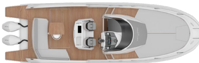
OUTBOARD MAINDECK LAYOUT WITH T-TOP