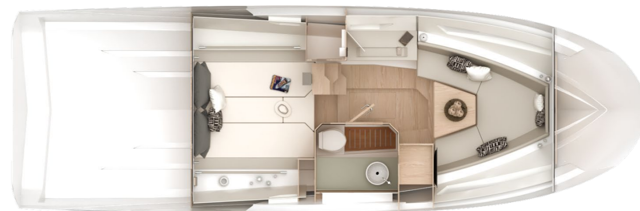
INBOARD LOWERDECK LAYOUT

The mix between the different colors and materials, together with the side windows on the hull, contributes to bright the area, that becomes even more livable during the day and the evening too.